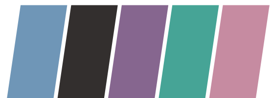
Azul - Preto - Roxo - Verde - Rosa